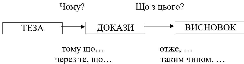
Схема розгорнутого роздуму

Стягнений роздум складається з двох частин: тези та доказу.